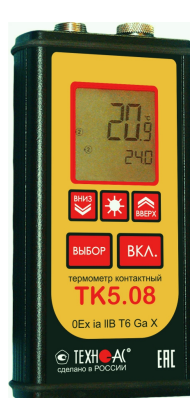
Рисунок 11 – Общий вид термометров контактных цифровых ТК-5 модификации ТК-5.08