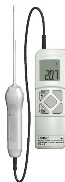
Рисунок 4 – Общий вид термометров контактных цифровых ТК-5 модификации ТК-5.01М