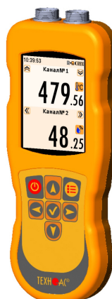
Рисунок 18 – Общий вид термометров контактных цифровых ТК-5 модификации ТК-5.27