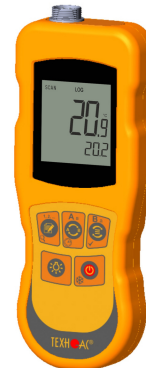
Рисунок 16 – Общий вид термометров контактных цифровых ТК-5 модификации ТК-5.09C