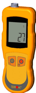
Рисунок 14 – Общий вид термометров контактных цифровых ТК-5 модификации ТК-5.04C