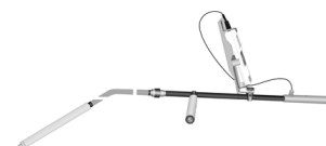
Рисунок 23 – Общий вид зондов погружаемых высокотемпературных (ЗПГВ)