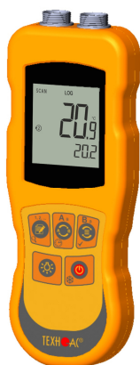
Рисунок 17 – Общий вид термометров контактных цифровых ТК-5 модификации ТК-5.11C