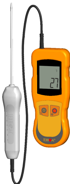
Рисунок 5 – Общий вид термометров контактных цифровых ТК-5 модификации ТК-5.01С