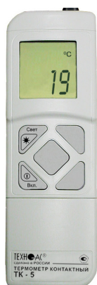
Рисунок 9 – Общий вид термометров контактных цифровых ТК-5 модификации ТК-5.04