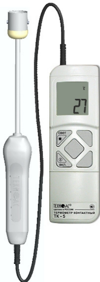
Рисунок 2 – Общий вид термометров контактных цифровых ТК-5 модификации ТК-5.01П