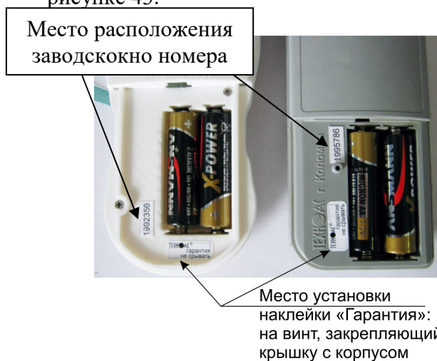
Схема пломбировки термометров от несанкционированного доступа приведена на рисунке 43.

Цветовая гамма корпусов термометров ТК-5.01С, ТК-5.01МС, ТК-5.01ПС, ТК-5.01ПТС, ТК-5.04С, ТК-5.06С, ТК-5.09С, ТК-5.11С, ТК-5.27 и ТК-5.29 может быть изменена по решению Изготовителя в одностороннем порядке.