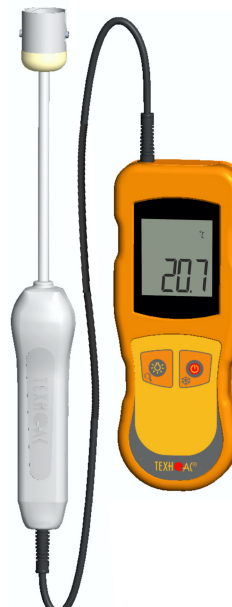
Рисунок 7 – Общий вид термометров контактных цифровых ТК-5 модификации ТК-5.01ПТС