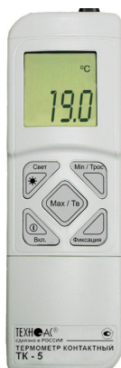
Рисунок 10 – Общий вид термометров контактных цифровых ТК-5 модификации ТК-5.06