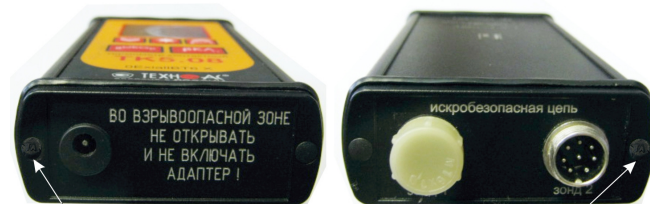
Рисунок 43 – Схема пломбировки от несанкционированного доступа. Место расположение заводского номера