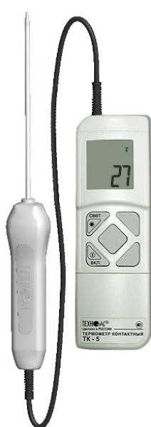
Рисунок 1 – Общий вид термометров контактных цифровых ТК-5 модификации ТК-5.01

Фотографии общего вида термометров и зондов представлены на рисунках 1-42.