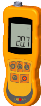
Рисунок 15 – Общий вид термометров контактных цифровых ТК-5 модификации ТК-5.06C