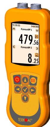
Рисунок 19 – Общий вид термометров контактных цифровых ТК-5 модификации ТК-5.29