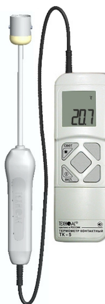
Рисунок 3 – Общий вид термометров контактных цифровых ТК-5 модификации ТК-5.01ПТ