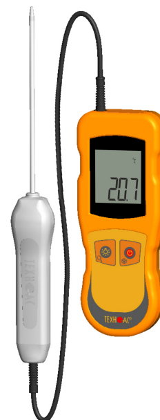
Рисунок 8 – Общий вид термометров контактных цифровых ТК-5 модификации ТК-5.01МС