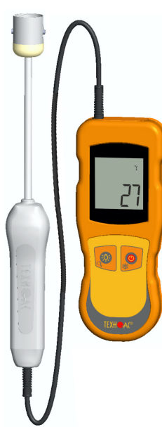
Рисунок 6 – Общий вид термометров контактных цифровых ТК-5 модификации ТК-5.01ПС