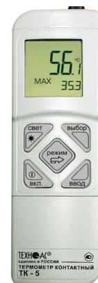
Рисунок 12 – Общий вид термометров контактных цифровых ТК-5 модификации ТК-5.09