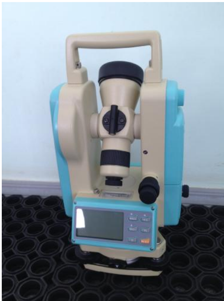
Рисунок 2 - Внешний вид теодолита