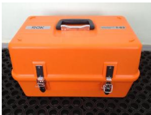
Рисунок 3 - Внешний вид футляра