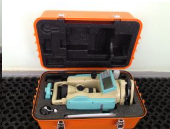
Рисунок 4 - Внешний вид размещения теодолита в футляре