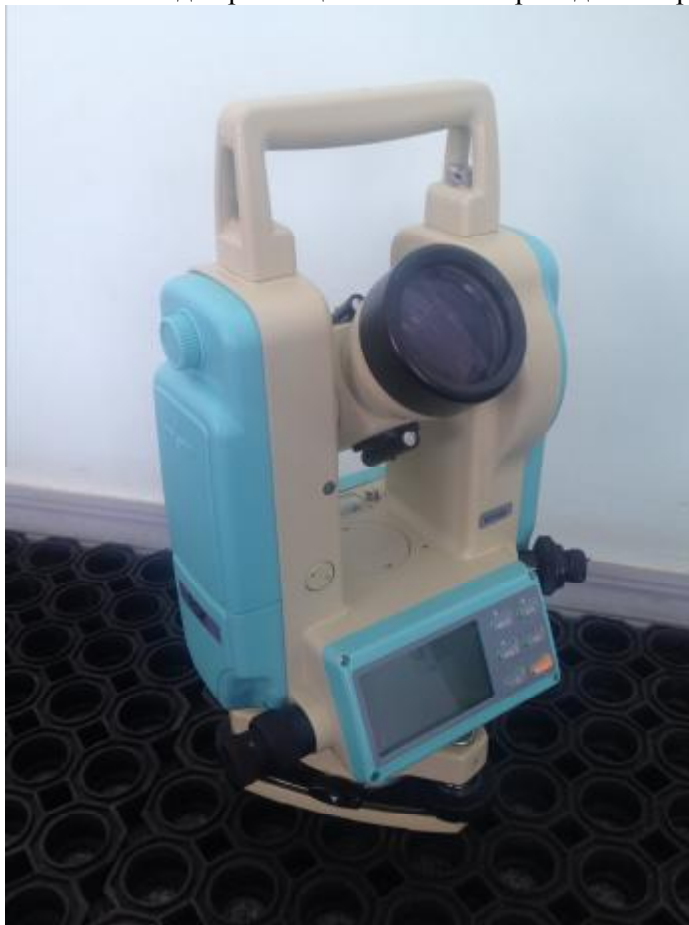
Рисунок 1 - Внешний вид теодолита

Схема обозначения мест для размещения наклеек приведена на рисунке 6.